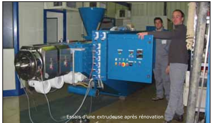
Essais d'une extrudeuse après rénovation