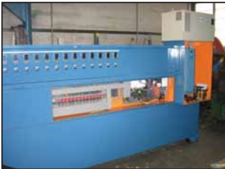
Détail d'une armoire de régulation + variation de vitesse climatisée

Gomez Technologies conçoit et réalise pour R2Plast toutes ses armoires d'automatisme. Forts d'une expérience de plus de 20 ans dans les machines de plasturgie, les techniciens de Gomez Technologies et de R2Plast créent ainsi une synergie issue de technicités complémentaires dans le process pour R2Plast, et l'automatisme pour Gomez Technologies. Les résultats pour le client sont une qualité et un niveau technologique irréprochables, identiques au matériel neuf.