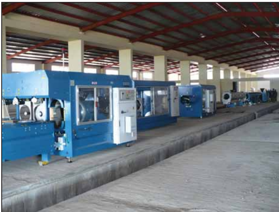
Ligne d'extrusion dans l'usine d'ABC Construcciones en Guinée Equatoriale Contrat «usine clé en main»